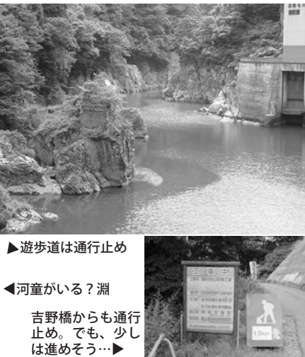
▶遊歩道は通行止め