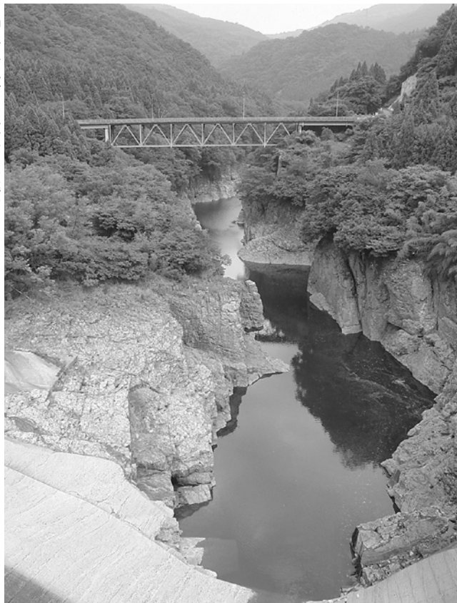
▶神通川第一ダム通路からの眺め